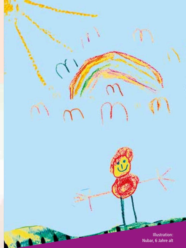
Illustration: Nubar, 6 Jahre alt